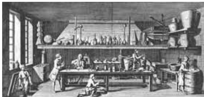
Figura 4. Laboratorio de química como se muestra en la Enciclopedia .

En ese momento, particularmente en 1787, apareció en inglés la palabra responsibility y once años después la francesa responsabilité . Este dato filológico, como se verá más adelante, no es trivial. Desde entonces y poco a poco, a la par de muchas de las ideas y formas de ver el mundo derivadas de la Revolución Francesa y la Revolución Industrial fue adueñándose de las sociedades europeas la convicción de que debemos asumir, sin excusa ni remedio posible, nuestros propios horrores como algo de lo que debemos dar cuenta [...] El mal [...] tal vez pueda ser banalizado, pero nunca más podrá volver a ser ignorado (Cruz, 2005, p. 117). El filósofo catalán Manuel Cruz indica de manera muy clara este cambio en la mentalidad de las nacientes sociedades industriales: