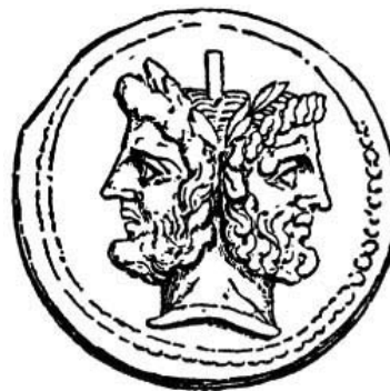
Figura 7. Moneda romana mostrando la imagen de Jano.

Con la quinta revolución química llegó el momento de las culpas. Como ya se dijo antes, la química “agazapada”, colonizada, impura y sucia se volvió un peligro planetario. 19 Muchos departamentos y facultades de química e industrias químicas cambiaron de nombre, eliminando precisamente la palabra química y/o agregando el de biología. En los Estados Unidos Harvard fue de los primeros seguido por Cornell, donde muchos de los nuevos investigadores, en recambio de la primera nutrida y jubilada generación de químicos que ingresaron a las universidades después de la Segunda Guerra Mundial, fueron desplazándose hacia temas bioquímicos. La química pasó a ser una de las ciencias biológicas. Perdió, tal vez, su frágil identidad y el sentido épico que la caracterizaba un siglo antes. Ésa es una de las dos caras de la química-Jano, 20 agaza-