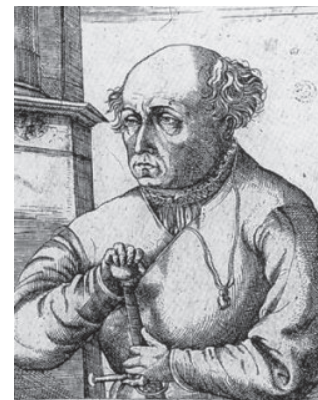
Figura 2. Paracelso (1493-1541).

Durante la primera revolución química, se terminan de