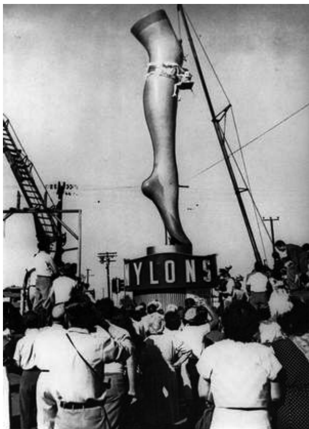
Figura 6. El nylon hace su seductora aparición. La invención por DuPont Co. de las medias de nylon causó una especie de revolución en la moda después de su debut en terrenos de la compañía en Wilmington, Delaware, EUA. En la foto, la actriz Marie Wilson, cuya pierna fue convertida en escultura en 1950 en Hollywood está colgada de un andamio por una grúa, como comparación.

ideas que, de manera práctica y cotidiana, los químicos asumen y utilizan para resolver problemas, generar explicaciones o hacer predicciones [...] Quizá la renuncia de los químicos a reconocer, de manera central y explícita, algunos de los conceptos e ideas que utilizan de manera práctica y cotidiana, es que algunos de ellos se refieren a propiedades “trascendentes” de las sustancias y los procesos en que éstas participan. Esto es, varios de estos conceptos identifican o describen entidades que están más allá de la esfera de lo perceptible y medible.