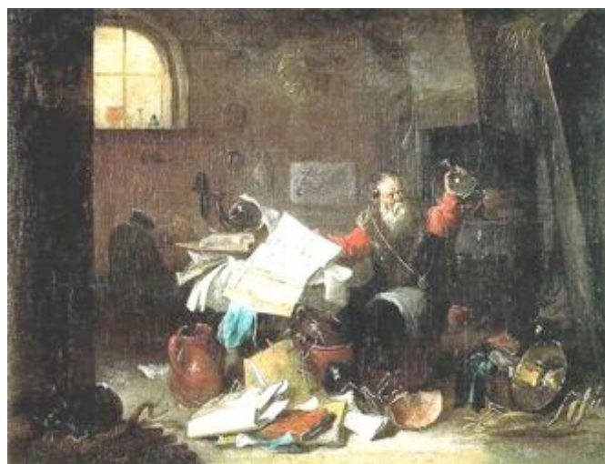
Figura 3. El alquimista.